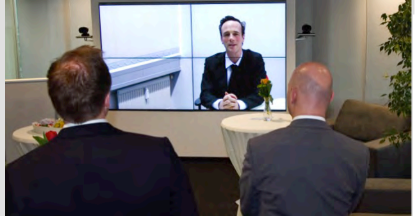
Der Trainer ist VOR ORT bei den Teilnehmern, der Spieler wird VIRTUELL für Simulationen integriert.