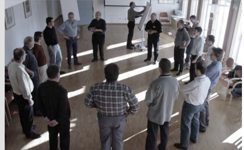
An einem EXTERNEN ORT in einem Veranstaltungsraum mit Bewegungsfreiheit.