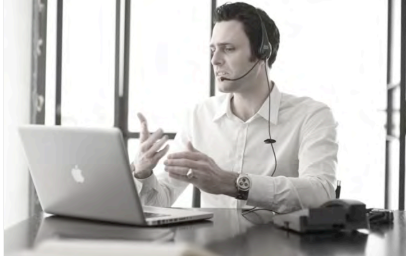
Rufen Sie uns an – wir erzählen Ihnen gerne mehr: 0700 – V I T A M I N T (+49-700-84826468)