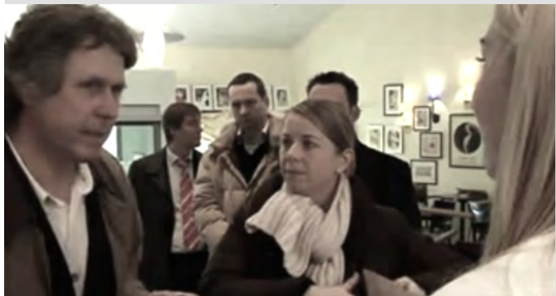
Direkt in der realen Kundenumgebung am POS / TOUCHPOINT (ohne parallelem Kundenverkehr).