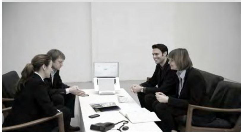
Bestellen Sie eine Live-Demo direkt in Ihrer Organisation zu einem aktuellen Thema.