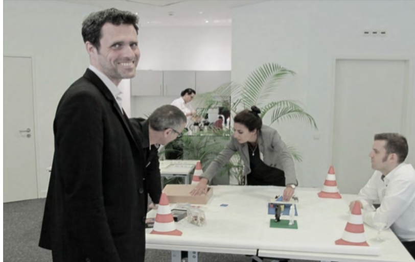
In IHRER ORGANISATION in einem separaten Raum.